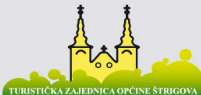
Turistička zajednica Općine Štrigova