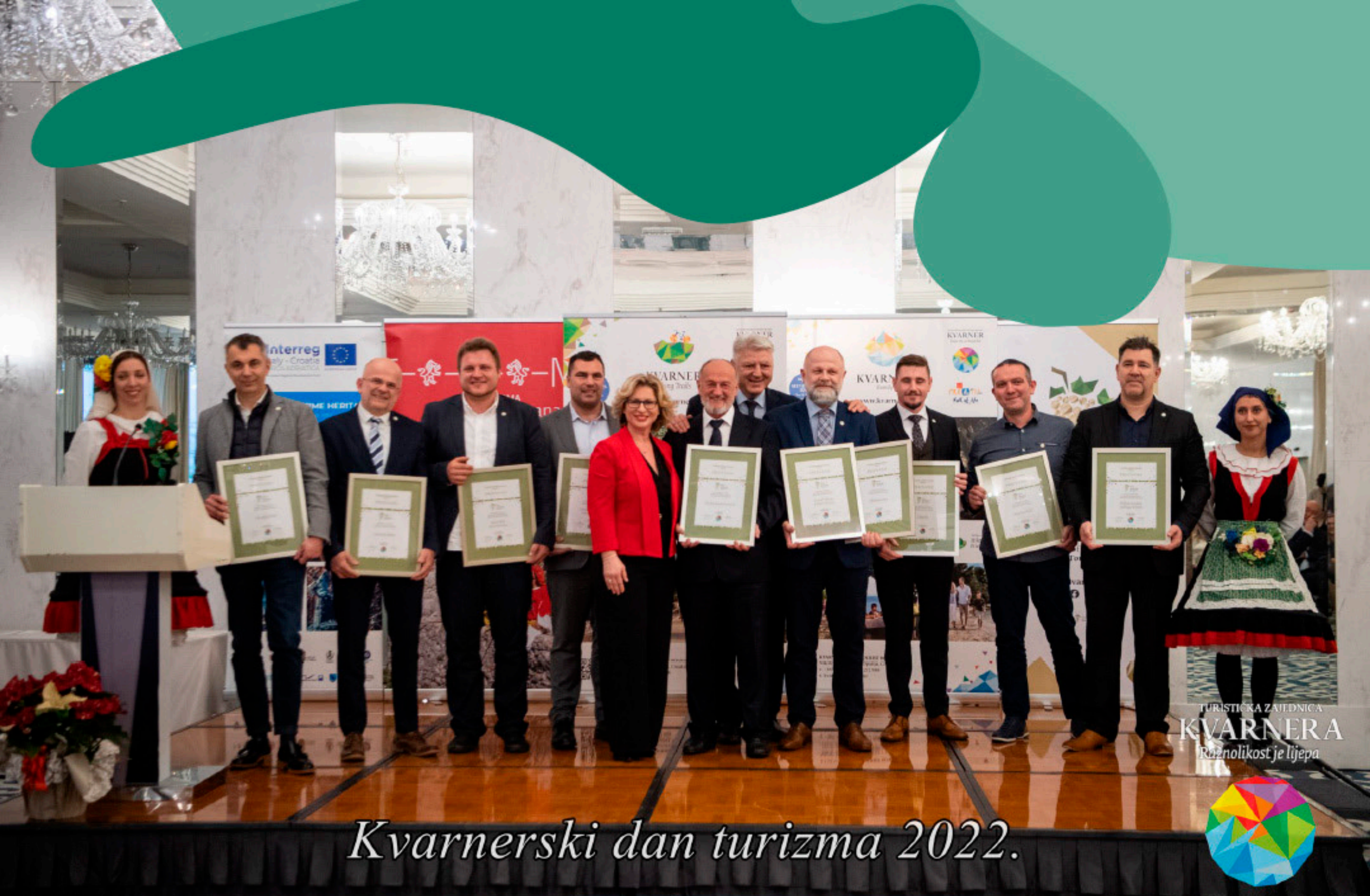
Kvarnerski dan turizma 2022.

TURISTIČKA ZAJEDNICA KVARNERA Raznolikost je lijepa