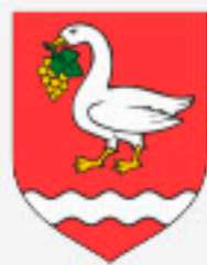
Turistička zajednica Općine Sveti Martin na Muri