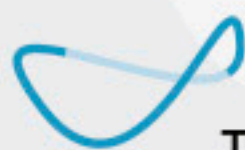
TERME SVETI MARTIN